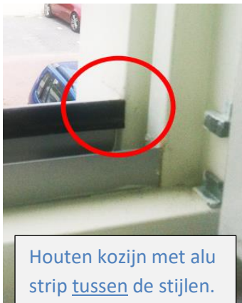
Houten kozijn met alu strip tussen de stijlen.