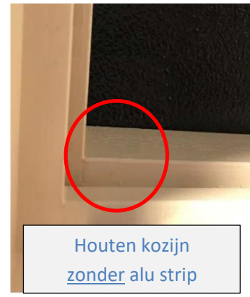
Houten kozijn zonder alu strip