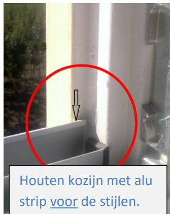
Houten kozijn met alu strip voor de stijlen.